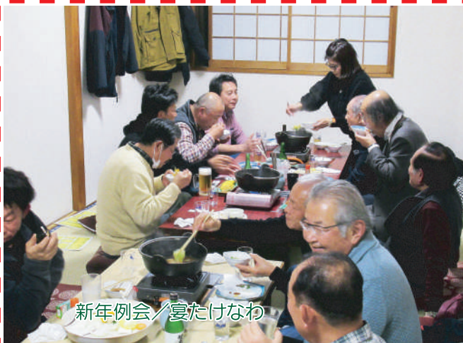
新年例会 / 宴たけなわ

令和4年年初は大雪のせいで家に閉じこもり「食っちゃ寝」の正月であった。松の内も間もなく終わるが(関東では1月7日迄らしいが関西では小正月(15日)迄が松の内)今年はどうなるのやら。ところで1月7日は5節句の一つ目「人日(じんじつ)七草粥をいただく日とされている。1月7日といっても本来旧暦の話で、今年2月7日がその日に当たる。前漢時代の文人・東方朔の「占書」によれば、正月一日を鶏の日、二日を狗(いぬ)の日、三日を猪の日、四日を羊の日、五日を牛の日、六日を馬の日、七日を人の日として、それぞれの日には、その該当する動物を殺さないようにし、七日は、罪人を処罰しないようにしていたそうである。また人日の天候が良ければ良い年、悪天候なら悪い年とされていたそうだが、今年の2月7日のお天気は晴天であってほしいものである。ところで、七草粥に入れる「春の七草」は和歌のように唄として覚えると覚えやすい。「せりなずな ごぎょうはこべら ほとけのざ すずなすずしろ これぞななくさ」平安時代の「延喜式」によれば、正月15日に7種の穀類(米・粟(あわ)・黍(きび)・稗(ひえ)・菘米(みの)・胡麻・小豆)で作った七種(ななくさ)粥を天皇陛下に供する風習があったそうで、後に正月初子(はつね)の日に野外で若菜摘みをする風習と合わさり、若菜で作った「七草粥」を食べるようになったという事である。ちなみに「若菜摘み」では、百人一首の光孝天皇の歌「君がため春の野に出でて若菜摘む我が衣手に雪は降りつつ」が思い出される。子どもの頃は上の句を聞いて札を取る正式な「かるた取り」は難しいので、もっぱら「坊主めぐり」しかしなかったが、それでも百人一首は今でもそこそこ覚えており、自分でも感心するところである。若菜には強い生命力があるとされているので、2月7日には是非七草の入ったお粥を食べて自然の持つ生命力をいただき、無病息災を願いたいと思う。 前川幸久