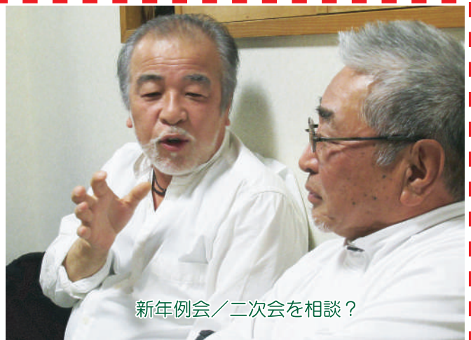
新年例会 / 二次会を相談?