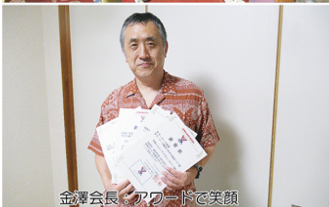
金澤会長：アワードで笑顔